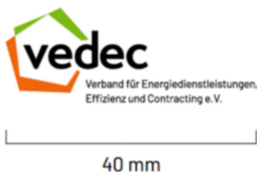
Mindestgröße für Printprodukte