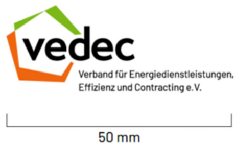
Standardgröße DIN lang Hoch- und Querformat