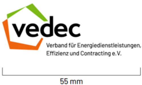
Standardgröße DIN A4, DIN A5